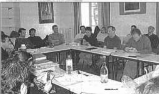
Les responsables du Comité ont dressé le bilan de leurs activités.

Le Comité départemental de spéléologie a constitué une banque de données traitant de tout ce qui touche au monde souterrain et au canyoning en Corse. En projet, une politique plus axée sur les jeunes, la création d'un Centre départemental de spéléo et un site Internet.